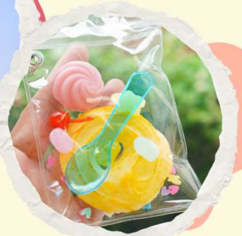
お菓子キーホルダー 1500円