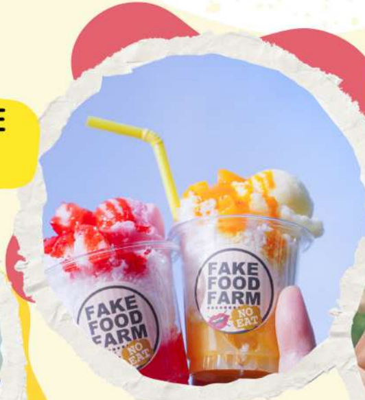
フローズンパフェ 1200円